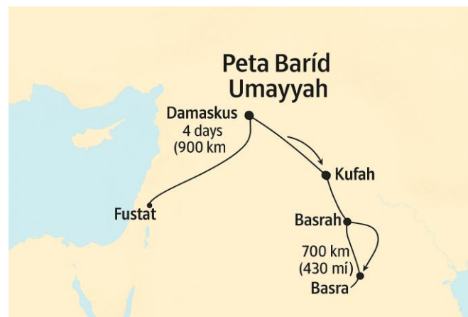
Gambar 3. Jaringan pos dan intelijen atau barīd Dinasti Umayyah

Salah satu elemen reformasi paling menarik adalah pelembagaan jaringan pos dan intelijen atau barīd (Gambar 3). Sebenarnya, sistem ini telah dirintis sejak era Muawiyah namun kemudian dikembangkan secara masif pada era kepemimpinan Abdul Malik. Setiap 12 mil di sepanjang jalur strategis seperti Damaskus–Kufah–Fustat dibangun stasiun lengkap, yaitu kandang kuda berkapasitas 30–40 ekor, bengkel pelana, penginapan kurir, dan gudang papyrus tahan air. Dalam praktiknya, pesan resmi berkode dapat dikirim dari Damaskus ke Kufah dalam empat hari yang menunjukkan sebuah efisiensi luar biasa dibanding karavan dagang biasa yang menempuhnya hampir tiga minggu. Kurir tidak hanya membawa pesan tetapi juga wajib menyusun laporan intelijen ringkas tentang harga pasar, kondisi militer setempat, dan gosip politik. Laporan-laporan ini dimasukkan ke dalam kantong kulit bertanda cap khalifah, menjadikan mereka mata dan telinga pusat kekuasaan.