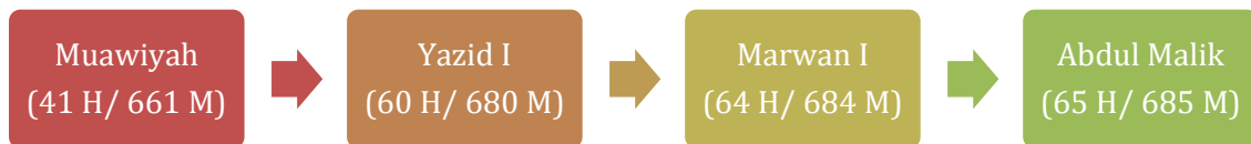
Gambar 1. Garis legitimasi Umayyah, 661–705 M

menemukan justifikasi Fiqih atas sistem bai'ah -wilayah yang diwariskan. 12 Dalam kerangka teori negara pra-modern, konsolidasi ini berfungsi sebagai mekanisme stabilisasi setelah perang internal, namun menanam benih oposisi ideologis (Syiah Zaydi, Khariji) yang kelak menggugat legitimasi dinasti. Dibandingkan Khulafaur Rasyidin, otoritas Umayyah bertumpu pada pengendalian aparat provinsi dan patronase suku, yaitu dominasi kelompok etno-politik seperti yang dikemukakan Crone (2015), 13 yang memungkinkan ekspansi cepat tetapi menciptakan ketegangan antar-koalisi suku dan sulit dikendalikan secara institusional. Dengan demikian, transisi 41 H bukan hanya peralihan figur, melainkan rekayasa institusional yang mendefinisikan ulang konsep kepemimpinan politik dalam Islam pada masa-masa awal.